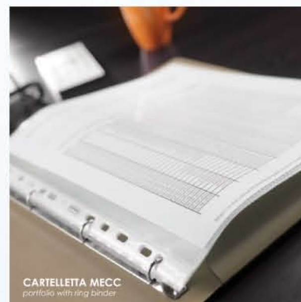
CARTELLETTA MECC portafolio with ring binder