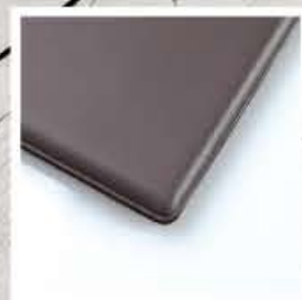
saldature doppie rinforzate