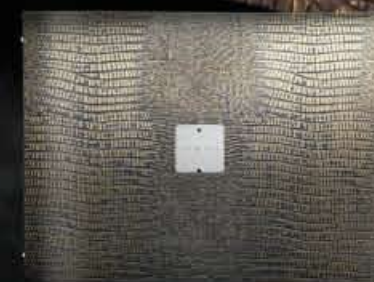
classic A4 ORIZZONTALE