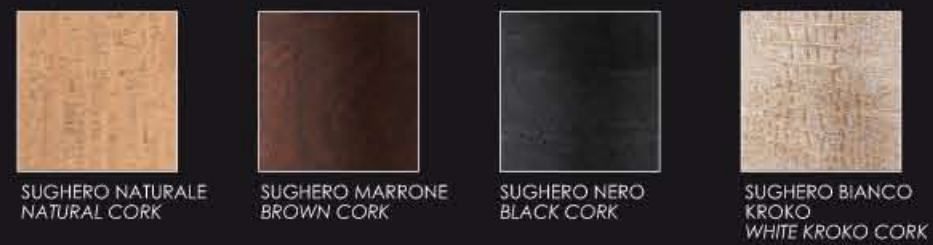
SUGHERO NATURALE NATURAL CORK

CORK line: washable, ecological and resistant