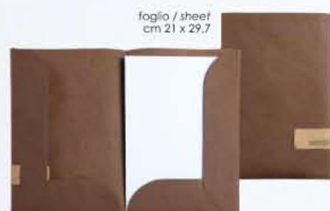
CARTELLETTA 2 tasche portafolio 2 pockets * solo etichetta PATCH nelle linee ECO e VINTAGE only PATCH label in ECO and VINTAGE lines