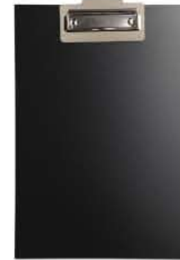
PORTA BLOCCO EASY notepad easy