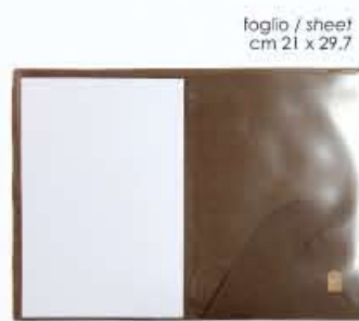
CARTELLETTA 4 BUSTE portafolio with 4 envelopes