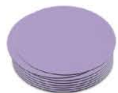
SOTTO BICCHIERE Ø10* coaster