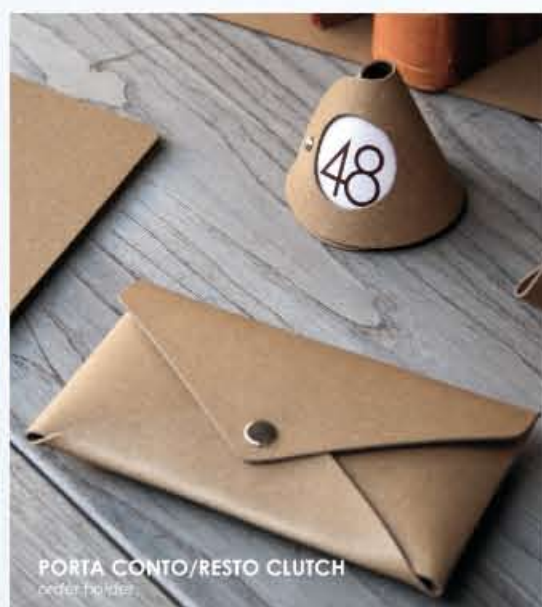
PORTA CONTO/RESTO CLUTCH order holder