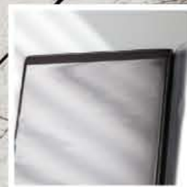
2 tasche di copertina