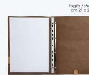
ANELLI portamenu con meccanismo menuholder with ring binder * non disponibile nelle linee ECO e VINTAGE not in ECO and VINTAGE