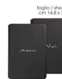
mediterraneo A5 menu/vini