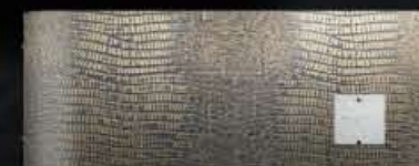
classic CLUB ORIZZONTALE