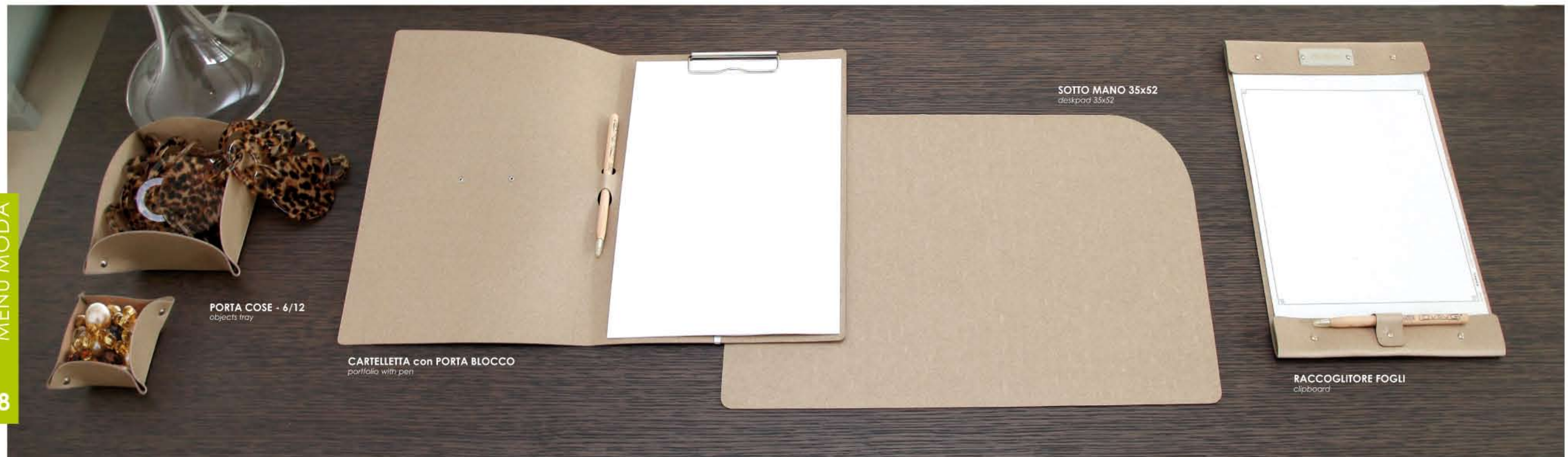
PORTA COSE - 6/12 objects tray