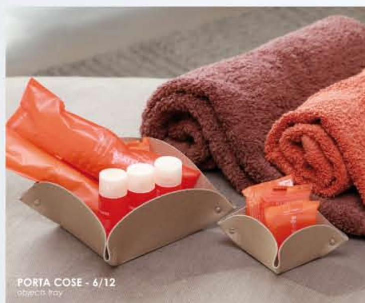
PORTA COSE - 6/12 objects tray