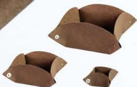
PORTA COSE 6/12/19 objects tray