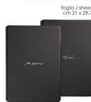
mediterraneo A4 menu/vini

6 BUSTE + 2 TASCHE 6 envelopes + 2 pockets