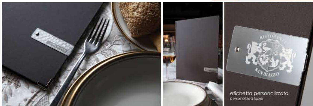
etichetta personalizzata personalized label

etichetta METAL / METAL label vedi pag. 54 interni con 6 buste e CLIP / interior 6 envelopes and CLIP