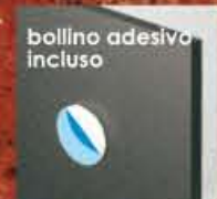
bollino adesivo incluso