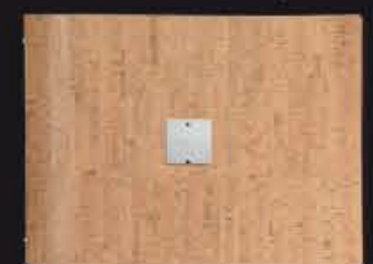
classic A4 ORIZZONTALE