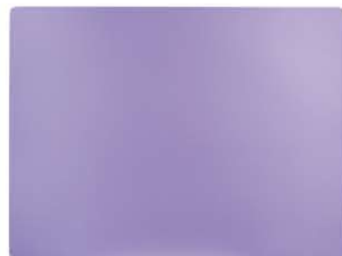
TOVAGLIETTA 21x32* placemat 21x32 TOVAGLIETTA 23x38* placemat 23x38 TOVAGLIETTA 32x34* placemat 32x34 TOVAGLIETTA 33x44* placemat 33x44 TOVAGLIETTA 31x41* placemat 31x41 TOVAGLIETTA 30x45* placemat 30x45 TOVAGLIETTA 34x34* placemat 34x34 TOVAGLIETTA 35x50* placemat 35x50

* non per le linee ECO e VINTAGE not for ECO and VINTAGE range