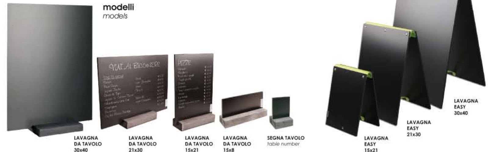
LAVAGNA DA TAVOLO 30x40