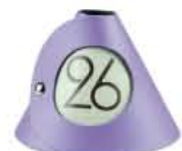
SEGNA TAVOLO table number