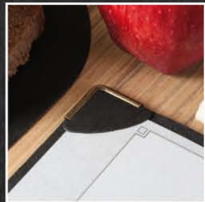
ferma fogli ad incastro block sheet