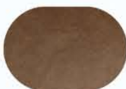
TAPPETINO FIRME 20x30 signature pad