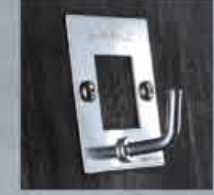
gancio in acciaio steel hook

serie VISUAL DESIGN linea PORTA LAVAGNE blackboard holder line - da interno ed esterno indoor and outdoor - legno trattato outdoor painting - mono e bifacciali 1 or 2 sides 50