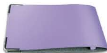
PORTA COMANDA order holder