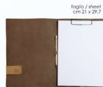
CARTELLETTA PORTABLOCCO portafolio with block sheets