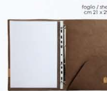
CARTELLETTA MECC portafolio with ring binder