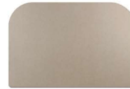
SOTTO MANO 35x52 deskpad 35x52