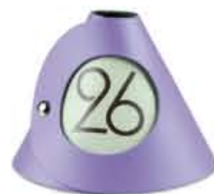
SEGNA TAVOLO BIFACCIALE 2 sided table number