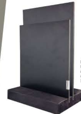
LAVAGNA PORTA MENU blackboard menu holder 20x30