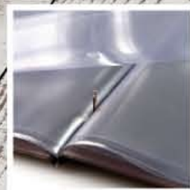
possibilità aggiunta buste con clip apri / chiudi