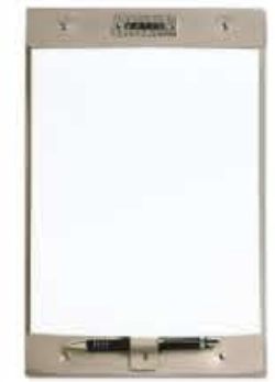
RACCOGLITORE FOGLI clipboard