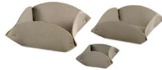
PORTA COSE 6/12/19 objects tray